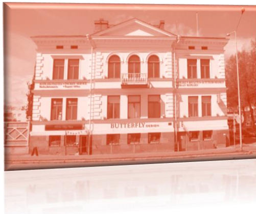
Kuvassa Puistokadun talo