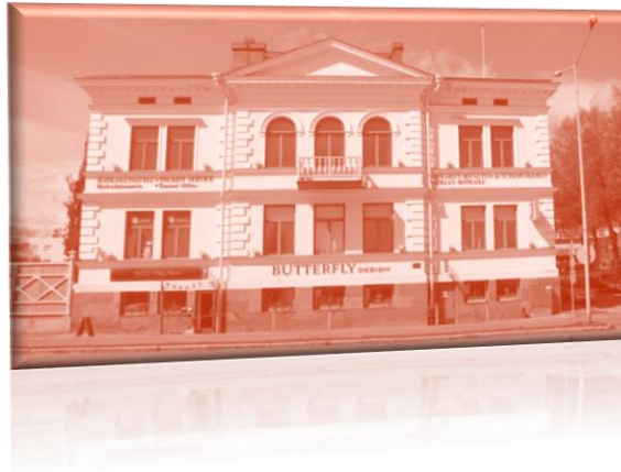
Kuvassa Puistokatu 1. talo

tihenkilöstöä palkataan tarpeen mukaan taloussuunnitelman ja rahavarojen puitteissa. Yhdistyksen kirjapidon hoitaa Punkatili, Punkaharjun tilitoimisto Oy. Yhdistyksen toimisto sijaitsee osoitteessa Puistokatu 1, Savonlinna.